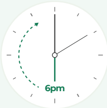
FASSTO 당일 출고 마감시간